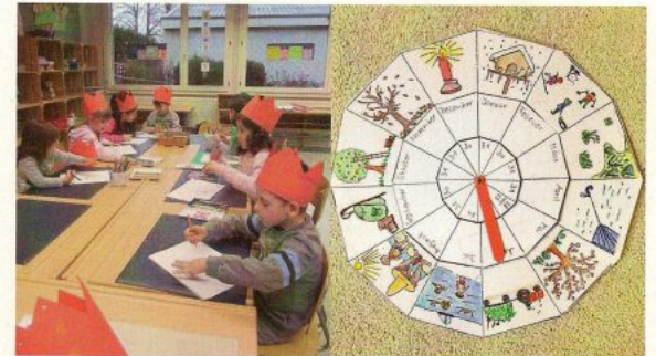
Die Kinder bleiben mit der anderen Kursleiterin im Kursraum. Wir wollen einen Jahreskalender basteln. Das gibt viel zu tun.

Wer mehr über MuKiDeutsch, Kurstage, -zeiten und -kosten wissen will oder sich für den nächsten MuKiDeutsch Kurs anmelden möchte: Auf dem Schulsekretariat, in den Kindergärten und im Schulhaus