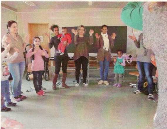
Wir singen gemeinsam das MuKiDeutsch Begrüssungslied.

Anschliessend an die MuKIFördersequenz trennen sich die Gruppen. Die Frauen arbeiten im eigenen Schulzimmer mit der einen Kursleiterin, die Kinder bleiben mit der anderen Kursleiterin im Kursraum.