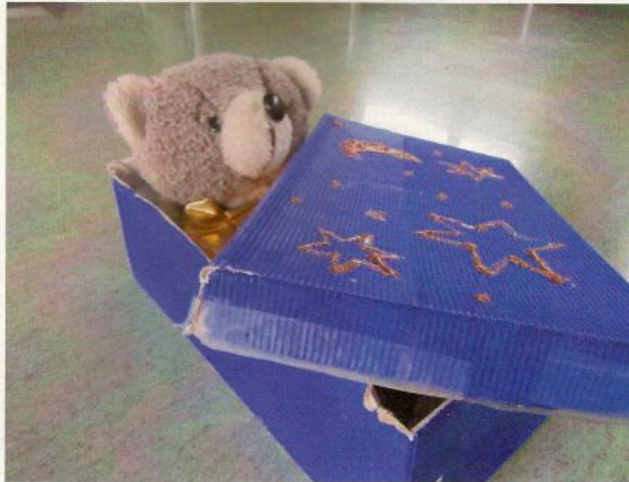
Der MukiDeutsch Bär

Bei dieser gemeinsamen Einstiegslektion lernen die Frauen und Kinder nicht nur Deutsch. Die Mütter üben zusätzlich, ihre Kinder beim Lösen von Aufgaben und Aufträgen anzuleiten und zu unterstützen. Und zuhause können sie mit ihren Kindern die gelernten Lieder und Verse repetieren. Zuhause sind dann nämlich die Mamas die Lehrerinnen ihrer Kinder und vielleicht ist es auch manchmal umgekehrt!